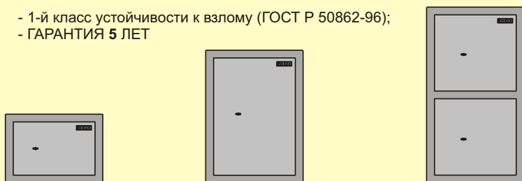
M410 MB-5 MB-6/2