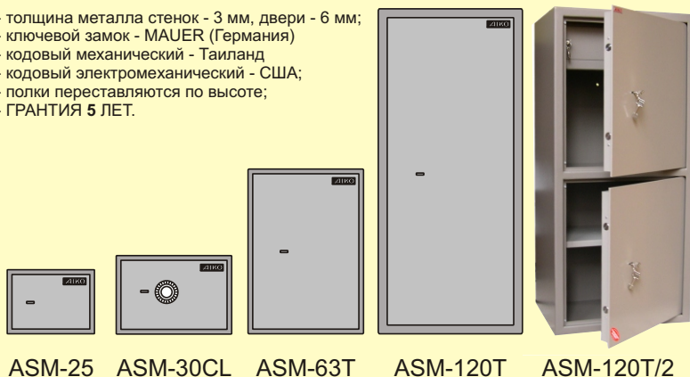
ASM-25 ASM-30CL ASM-63T ASM-120T ASM-120T/2